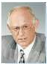
Председатель Попечительского Совета Негосударственного пенсионного фонда «Образование и наука» Бальшин Григорий Артемович — Председатель Комитета Госдумы РФ по образованию